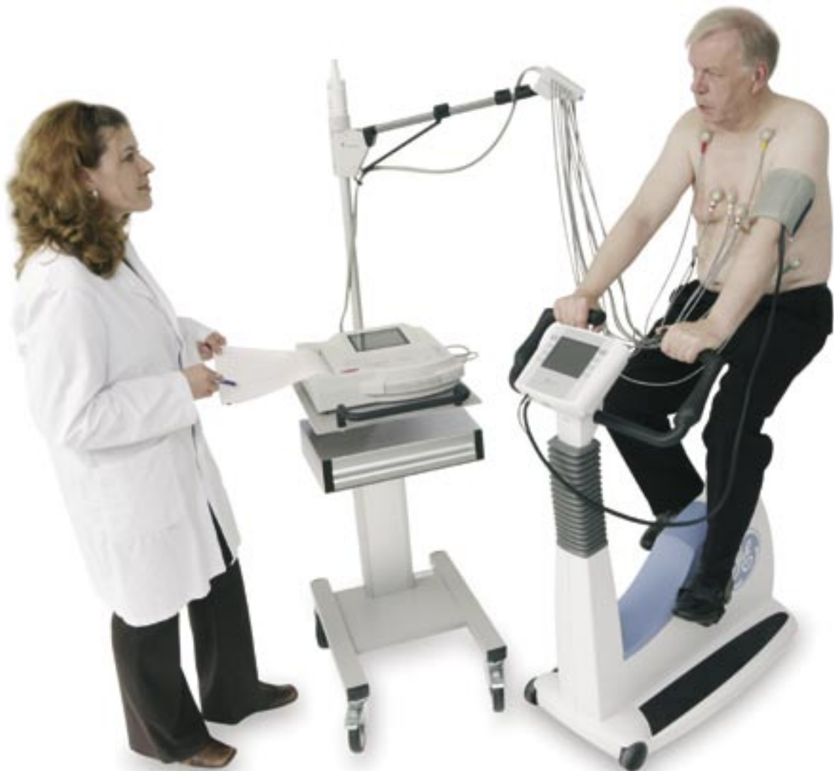
MAC 1200 ST dem Elektroden-Applikationssystem KISS und eBike comfort PC plus